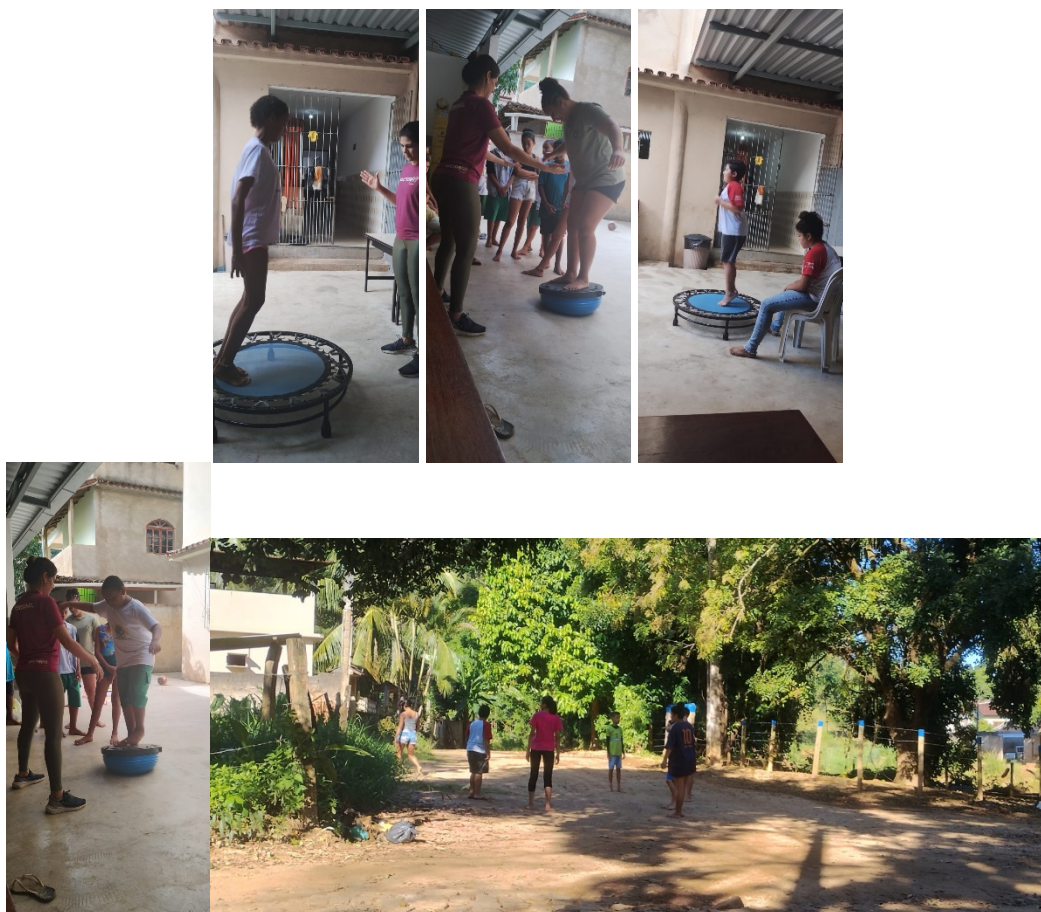
Grupo 3 e 4: Usuários – 18 a 59 anos e Acima de 60 anos