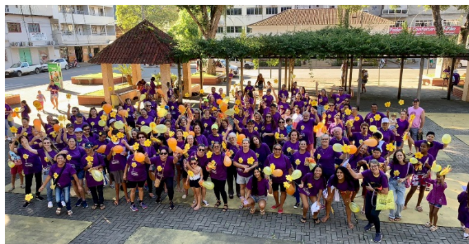
Grupo 2: Usuários Adolescentes – 11 a 15 anos